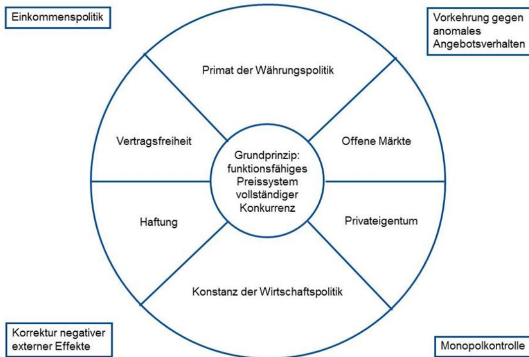
Abbildung 1 Ordnungspolitischer Kanon

Wie die Abbildung zeigt, ist das Grundprinzip ein funktionsfähiges Preissystem. Preise haben in der Marktwirtschaft eine wesentliche Signal- und Informationsfunktion (durch Preise wird Knappheit angezeigt) und sorgen so für eine effiziente Mittelverwendung.