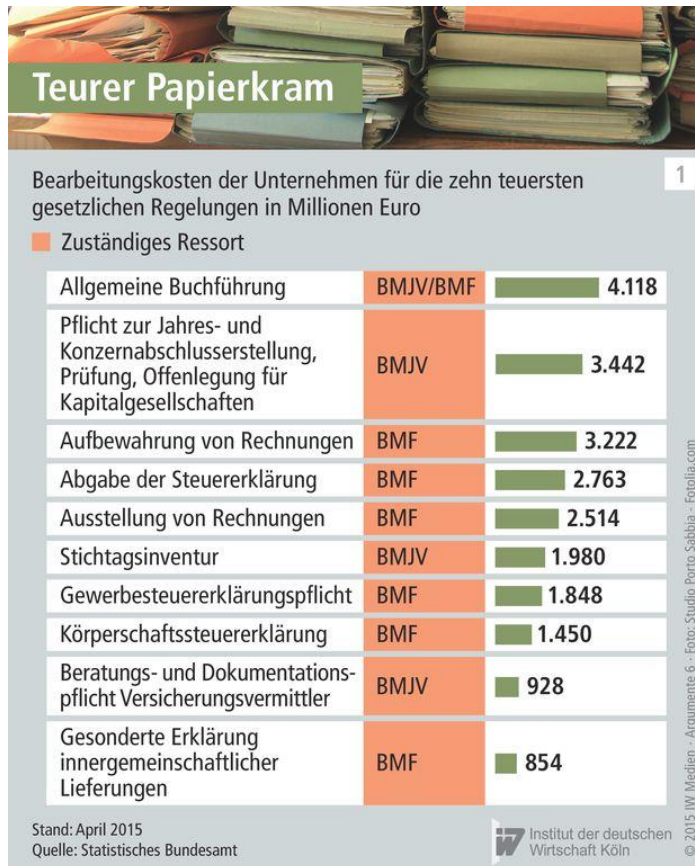
Abbildung 1 Teurer Papierkram