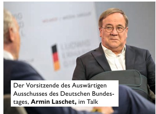
Der Vorsitzende des Auswärtigen Ausschusses des Deutschen Bundestages, Armin Laschet , im Talk

Die vbw war erneut Co-Veranstalter des ersten Tages des Ludwig-Erhard-Gipfels am Tegernsee. Im Mittelpunkt standen an diesem Tag die Soziale Marktwirtschaft und die Frage, wie eine gute Zukunft aus eigener Stärke gelingen kann.