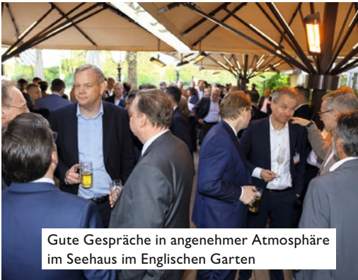
Gute Gespräche in angenehmer Atmosphäre im Seehaus im Englischen Garten