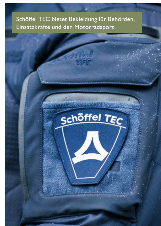
Schöffel TEC bietet Bekleidung für Behörden, Einsatzkräfte und den Motorradsport.

Der Standort Bayern, insbesondere Schwabmünchen, sei für das Unternehmen das Herz von Schöffel, betont der Inhaber. Hier liegen die Wurzeln des Unternehmens und hier wird die Marke bis heute geprägt. Als familiengeführtes Unternehmen fühlt sich Schöffel nach eigenem Bekunden tief in der Region verwurzelt. Deshalb würden Entscheidungen auch langfristig, verantwortungsvoll und generationenübergreifend getroffen. Gleichzeitig bietet die Nähe zu den Alpen einen direkten Bezug zur Natur und zu den realen Einsatzbedingungen der Produkte. Diese Authentizität ist für das Unternehmen ein entscheidender Faktor in der Produktentwicklung – denn hier wird das getestet und erlebt, wofür Schöffel steht. ■