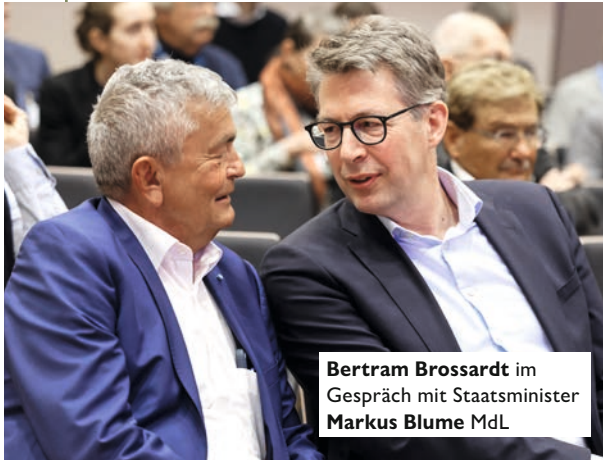
Bertram Brossardt im Gespräch mit Staatsminister Markus Blume MdL