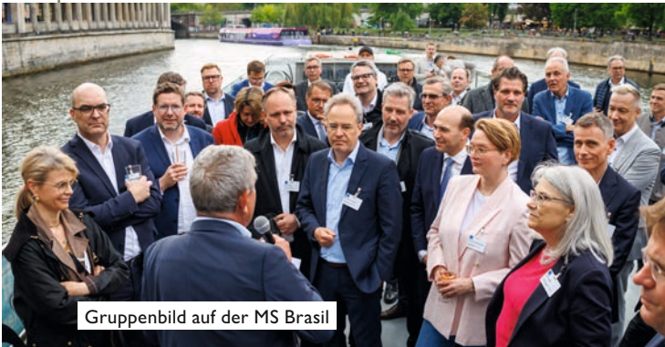
Gruppenbild auf der MS Brasil