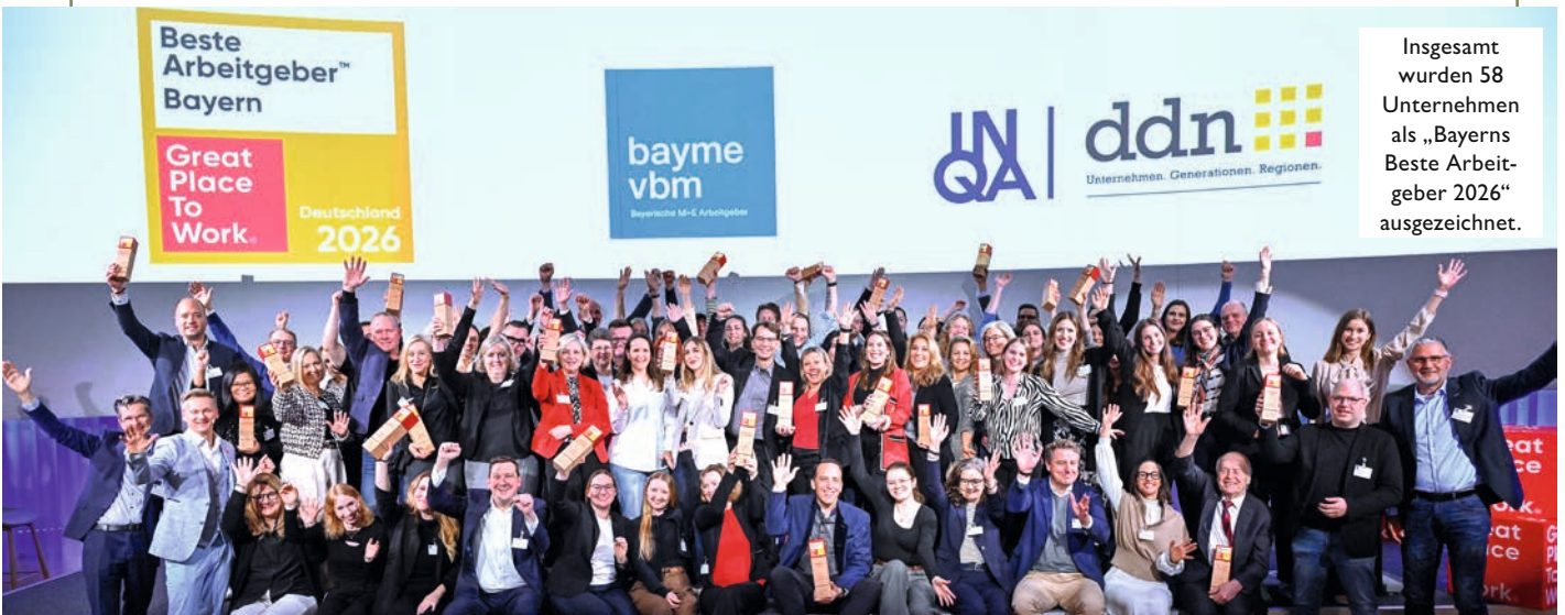
Insgesamt wurden 58 Unternehmen als „Bayerns Beste Arbeitgeber 2026“ ausgezeichnet.