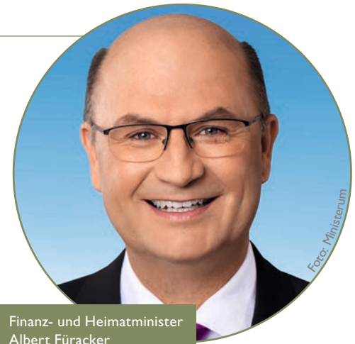
Finanz- und Heimatminister Albert Füracker

Und von Anfang an habe Bayern dabei ausschließlich auf Glasfaser gesetzt, versichert Füracker. „Mit unserem bayerischen Förderverfahren haben wir von Beginn an vorausschauend und einzig auf den Ausbau von Glasfaser abgezielt – wir haben keinen Meter Kupfer gefördert.“